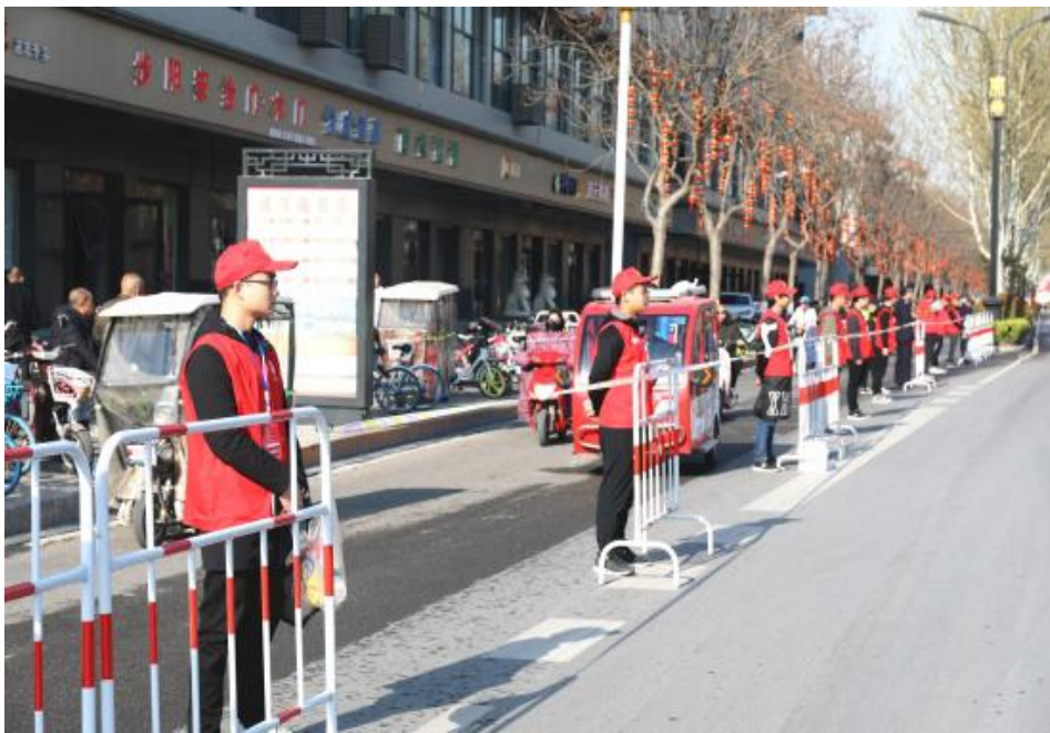
志愿服务活动现场（一）

春光明媚，惠风和畅。3月31日，郑开国际马拉松赛激情开赛。我校“小水滴”志愿服务队200余名志愿者参加大赛志愿服务工作。