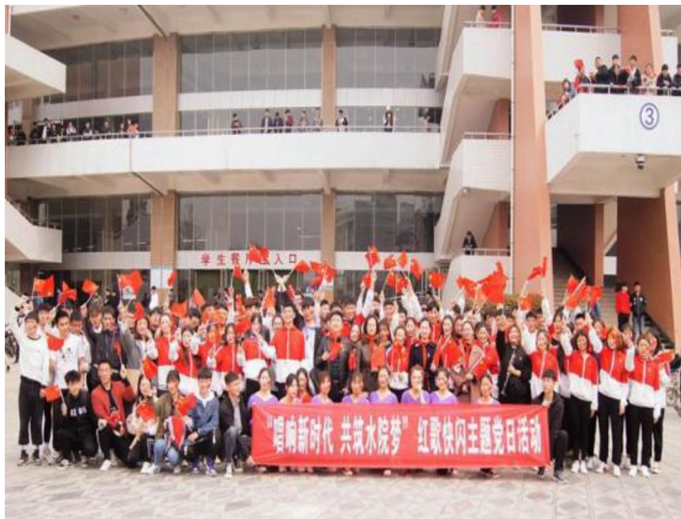
艺术与设计学院、土木与交通学院的师生共同演出后合影

此次策划红歌“快闪”主题党日活动，意在让主旋律在水院师生中唱响，让正能量在黄河水院传播。活动激发了师生的爱国