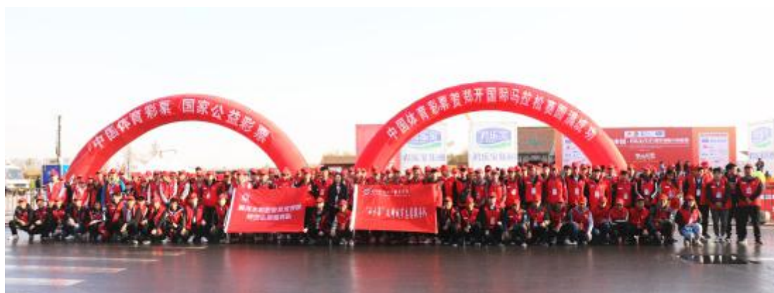
志愿者在比赛结束后合影