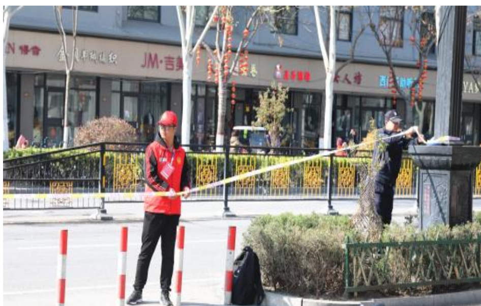
志愿服务活动现场（二）

选手加油鼓劲、呐喊助威。我校志愿者秉承“奉献、友爱、互助、进步”的志愿精神，严格遵守赛场纪律和志愿工作基本规范，以热情饱满的精神状态和认真负责的服务态度投入工作，以无私奉献的精神、细致周到的服务，激扬着我校大学生的青春风采，诠释着服务社会、提升自我的志愿服务精神。